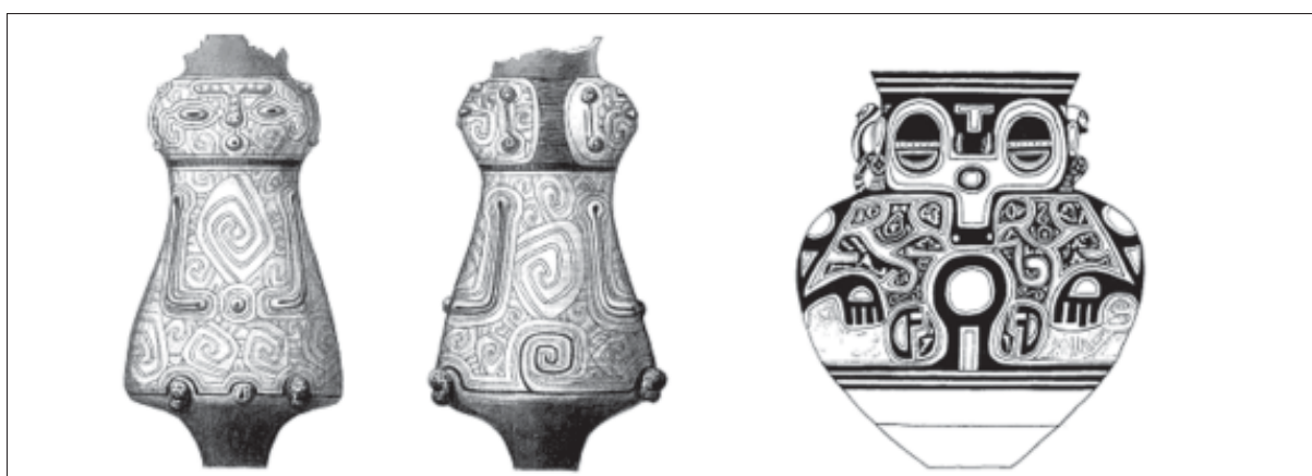
Figura 2. Urna do tipo Pacoval Inciso (à esquerda), aquarela de Miguel Pastana, Coleção do Museu do Estado do Pará; urna do tipo Joanes Pintado (à direita), ilustração de K. van Dyke, em Roosevelt (1991, p. 47)